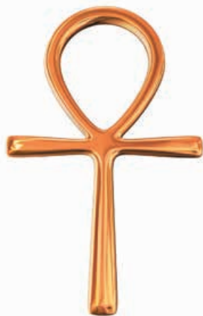
Egipski znak anch

Złoto jako środek nasercowy i uspokajający stosuje się nie tylko w wielu rozmaitych kulturach, lecz także w najprzeróżniejszych systemach lecznictwa. Dla chińskich medyków na przykład stano-