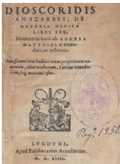
De Materia Medica

wiło ono ważne lekarstwo na zarówno wszelkiego rodzaju dolegliwości duchowe, jak i na inne schorzenia układu nerwowego, podobnie zresztą jak dla indyjskich lekarzy ajurwedyjskich 9 . Obydwu tym grupom utożsamianie złota ze słońcem – z racji jego koloru oraz cech charakterystycznych – przychodziło wtedy dość naturalnie, tym bardziej, że złoto (podobnie jak słońce) było postrzegane przez nich jako wyraz życiodajnej i krzepiącej siły. Ponadto złoto koloidal-