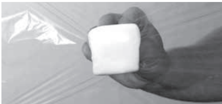
To zdjęcie przedstawia gładką powieź i skórę pozbawioną cellulitu. To pianka naciskająca na folię spożywczą.

Celem pracy z naszą ukochaną tkanką jest przywrócenie jej optymalnego stanu i gładkości przez zmianę „zewnątrznej otoczki”. Dla twojej informacji, jeśli jesteś szczupła i masz trochę luźnej skóry: fałdki i obwisłości pogarszają to, jak prezentują się Rany Gradowe. Gdy nabierzesz trochę mięśni, skóra będzie bardziej napięta i zmniejszy się intensywność tego typu cellulitu. Zawczasu ostrzegam, w przypadku pracy z cellulitem, o którym tu mowa będziesz miała dużo siniaków, gdy powieź zacznie się rozluźniać. Nie martw się, zazwyczaj nie boli to tak strasznie, jak wygląda.