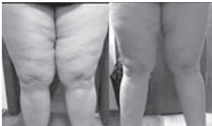
Powyższe zdjęcia przedstawiają cellulit typu Gumiś przed i po terapii.

Podsumowując, praca z tym rodzajem cellulitu polega na odblokowaniu napiętej powięzi, co umożliwi dotarcie do tkanki mięśniowej, dzięki czemu organizm może działać skuteczniej, a ty możesz pracować nad swoją tężyzną fizyczną – może po raz pierwszy w życiu.