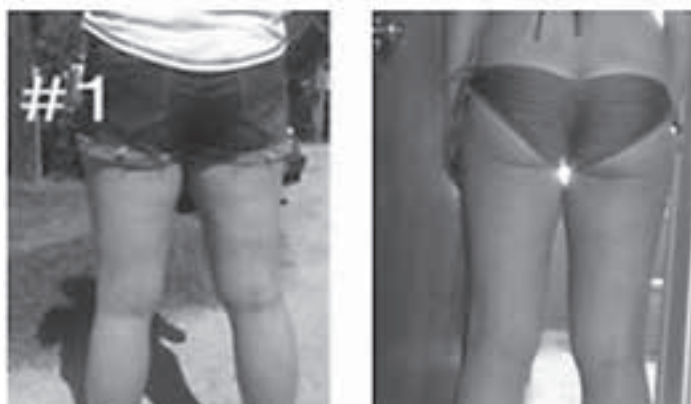
Zdjęcia przedstawiające etapy przed i po kuracji cellulitu BeyondBound™. Mimo że nie tak widowiskowy, ten rodzaj jest najbardziej dotkliwy dla organizmu.

to może trochę dłużej, bo O.Z.Z. znajdują się we wszystkich warstwach powięzi. W tym stanie wspinasz się po drabinie typów Dziwaczenia Powięzi i prezentujesz spory repertuar objawów związanych ze stanem tej tkanki. Przy BeyondBound™ powięź jest tak napięta, że nie możesz nawet uszczypnąć czy pociągnąć za swoją skórę, bo pod nią znajdują się twarde i złączone kawałki tkanki powięziowej. Osoba, u której ten stan opisuje całą strukturę ciała, przez większość czasu nie ma energii i ma problemy z krążeniem. Ciężko wtedy jakkolwiek ćwiczyć, często pojawiają się również skurcze nóg, wraz z chmurą innych problemów zdrowotnych napędzanych brakiem zdrowia tkanki powięzi. Jest jednak nadzieja, to wszystko można cofnąć!