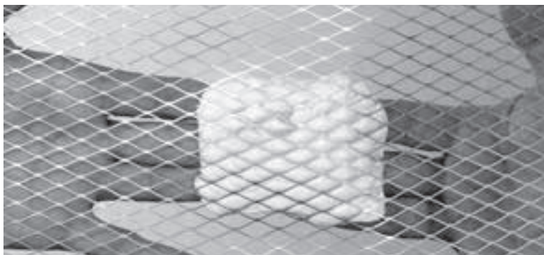
To zdjęcie przedstawia powięź, która wywołuje cellulit pod postacią Ran Gradowych. To pianka wciskana w siatkę.

Najprostszym sposobem na wizualizowanie sobie tego rodzaju powięzi jest metafora „skórki” w parówce czy kielbasce. (Wybacz mi, jeśli nie jesz mięsa, ale jej walory estetyczne naprawdę mają tu sens). Przy robieniu kielbasy wpycha się zmielone mięso do odpowiedniej formy. Kształt kielbasy nie zależy od ilości tłuszczu w mięsie. Jej wygląd jest zdeteminowany przez rozmiar i wygląd jej otoczki! Jeśli ta ma w sobie rowki jak piłka golfowa, to ostatecznie kielbaska będzie miała bruzdy dokładnie jak piłka. Gdy otoczka będzie wyglądała jak Myszka Mickey®, cała kielbasa będzie wyglądała tak samo. Teraz wyobraź sobie, że nasza błonka jest jak kabaretki. Jakiego możemy spodziewać się wyglądu tego produktu masarskiego? Ależ tak! Mięso będzie wysuwać się przez drobne otwory i wytworzy grudki, wgniecenia i wybrzuszenia. Brzmi znajomo... może przypomina to jakieś znajome nogi? Gdy powięzi są pozbawione wigoru, obecne są zaburzenia, zaciśnięcia, naciągnięcia i wybrzuszenia tkanki tłuszczowej wyciskającej się przez luki, tak jak to wygląda w przypadku mielonego mięsa w kabaretkach. (Wegetarianie mogą pomyśleć o wielkiej piance przyciskanej do siatki ogrodzeniowej!).